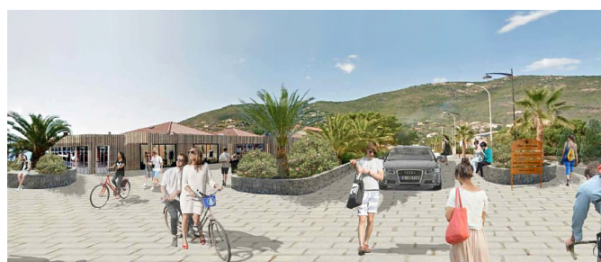
Projet d'aménagement de la Zone 30