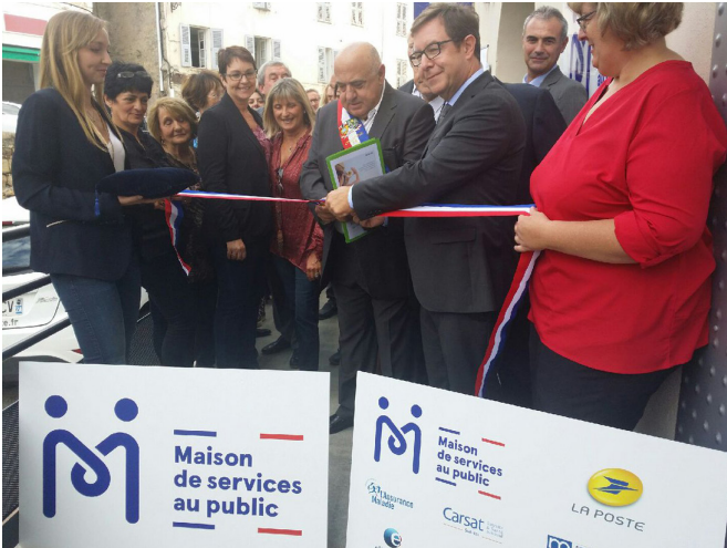
Inauguration de la Maison de services au public