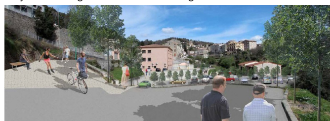
Aménagement de l'entrée du bourg : voirie et stationnement