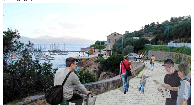
Projet d'aménagement du port de plaisance de Sagone