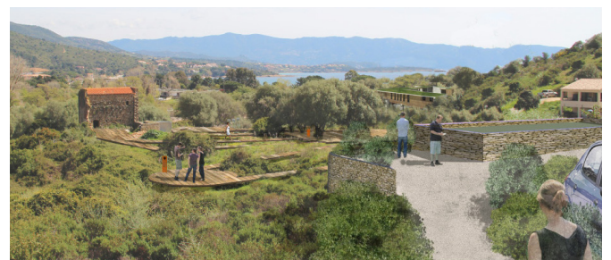
Sant'Appianu : création d'un centre d'interprétation et d'un parcours pédagogique