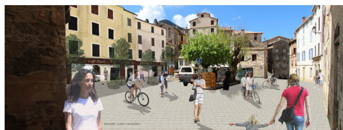
Projet d'aménagement du centre bourg de Vico