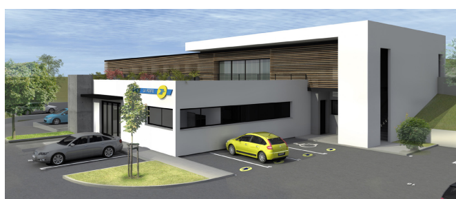
Projet du pôle administratif