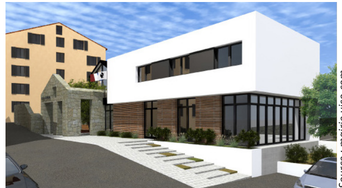
Projet de la nouvelle mairie à Vico

Ce pôle administratif est à resituer dans un projet plus global de réaménagement du secteur de Sagone comportant plusieurs aspects :